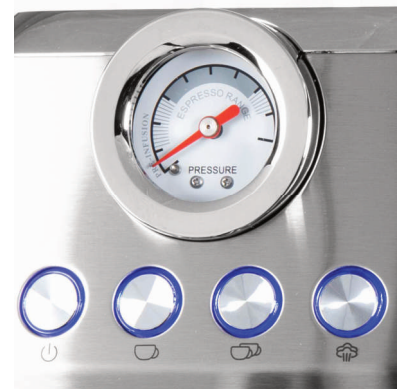
Kontrolfunktion med trykmåler til den optimale espresso