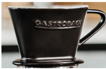
MEDFØLGER PORCELÆN KAFFE-FILTER (Str. 1X1)