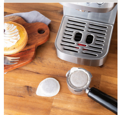
E.S.E.-puder: praktiske og miljøvenlige