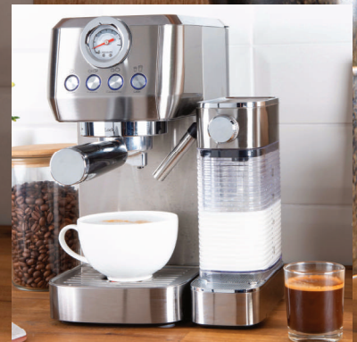
Mælkebeholder (700 ml) aftagelig, egnet til opvaskemaskiner

Oplev kaffekunst på et nyt niveau med DESIGN ESPRESSO PICCOLO PRO M. Denne espressomaskine er skabt til kaffeentusiaster, der ønsker en ubesværet og autentisk kaffeoplevelse derhjemme. Med et portafilterdesign og integreret automatisk mælkeskummer kan du nemt brygge espresso, cappuccino og latte macchiato med blot et enkelt tryk på knappen.