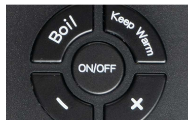
PRÆCISE JUSTERING AF VAND TEMPERATUREN