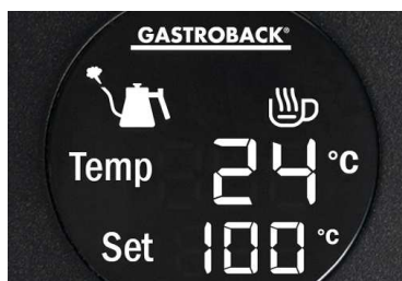
DISPLAY AF VAND TEMPERATUREN OG FUNKTIONER VIA LED DISPLAY