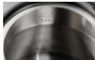
RUSTFRI STÅLKANDE MED 1 LITER VOLUME OG NIVEAU INDIKATOR