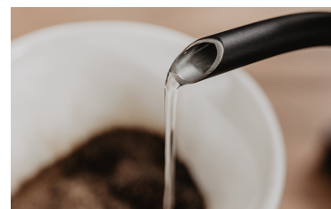
SVANEHALS FOR EN JÆVN VAND DISTRIBUTION